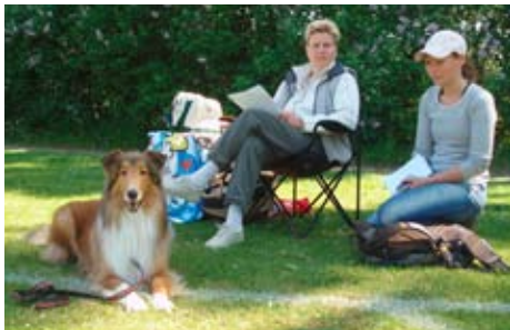
Prøvestemning søndag i LP