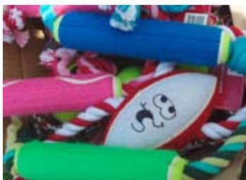
Der var legetøj til alle... uanset placering på dagen