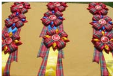
Flotte rosetter til de tre bedste i hver præmie-gruppe