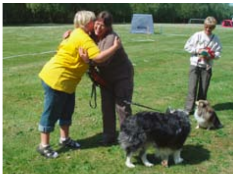
Stort tillykke med championtitlen i Rally