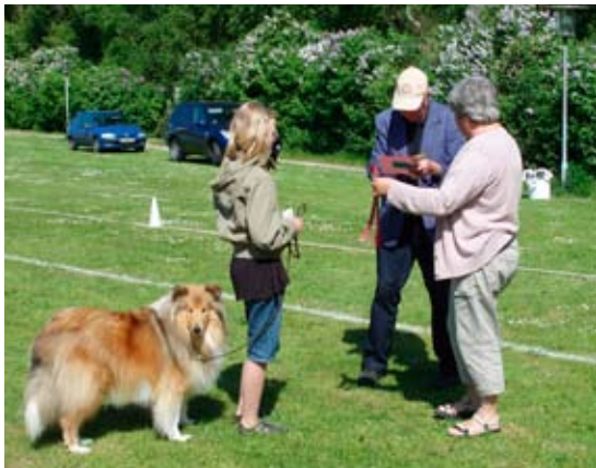
Præmieoverrækkelse i klasse LP2

Fredag aften byggede vi baner.....satte telte op, og i det hele taget sikrede, at alt var på plads til de næste to dages prøve-events... Lørdag morgen mødtes vi tidligt.....uha.....er der noget vi har glemt ???.....som medarrangør, er man altid lidt spændt på om det hele klapper, men alt var på plads og da dommerne efter en lækker morgenbuffet meldte klar til de officielle prøver kl. 10:00....ja, så kørte det hele som i olie, indtil vi succesfuldt kunne pakke sammen søndag ud på eftermiddagen.