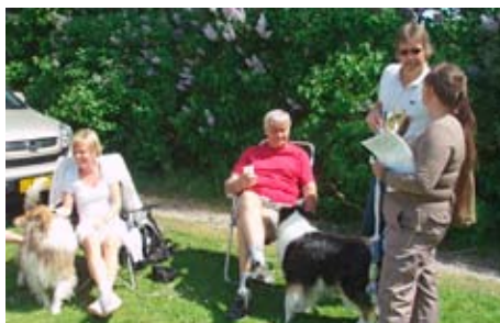
Hyggesnak ved ringsiden