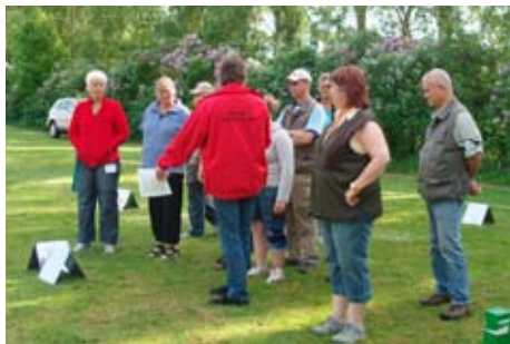
Banegennemgang i Begynderklassen