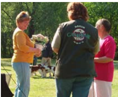
Tak til dommere og sekretærer