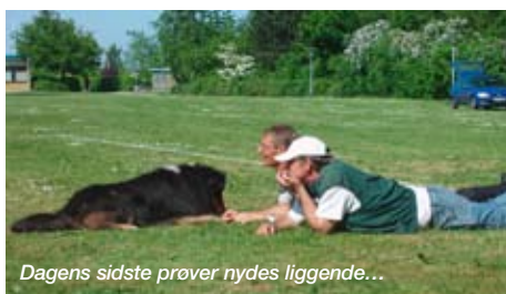
Dagens sidste prøver nydes liggende...

Fredag aften byggede vi baner.....satte telte op, og i det hele taget sikrede, at alt var på plads til de næste to dages prøve-events... Lørdag morgen mødtes vi tidligt.....uha.....er der noget vi har glemt ???.....som medarrangør, er man altid lidt spændt på om det hele klapper, men alt var på plads og da dommerne efter en lækker morgenbuffet meldte klar til de officielle prøver kl. 10:00....ja, så kørte det hele som i olie, indtil vi succesfuldt kunne pakke sammen søndag ud på eftermiddagen.